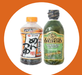
調味料各種 食用油