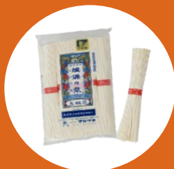
乾麺 そば・うどん・パスタ