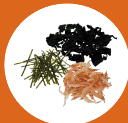
乾物 ふりかけ・のり