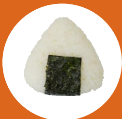
米・お餅・小麦粉