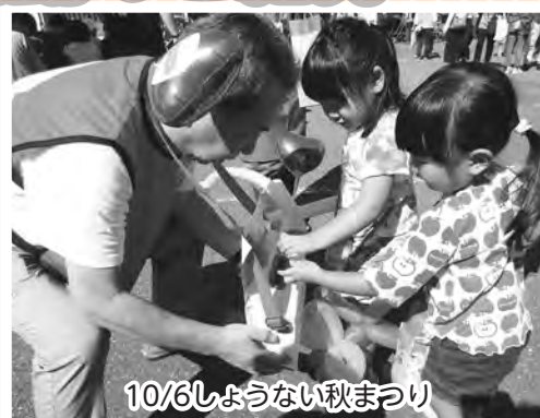
10/6しょうない秋まつり

10月1日(火)庄内空港にて「赤い羽根空の第一便メッセージ伝達式」が行われました。ANA（全日空）関係者・ボランティア連絡協議会のご協力をいただき、Aコープあまるめにて街頭募金を実施しました。また、10月6日(日)「しょうない秋まつり」において本会理事の参加のもと募金活動を実施しました。多くの町民の皆さまにご協力いただき、36,045円の募金が集まりました。ご協力いただきありがとうございました。