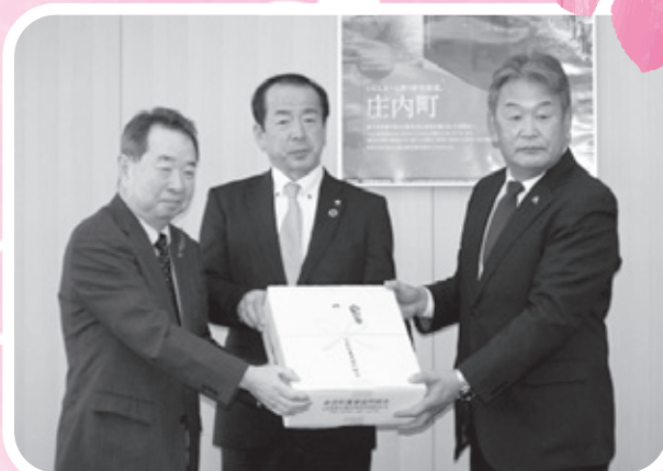
福祉餅の寄贈（余目町農協）