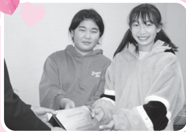
歳末たすけあい運動（余目第三小学校児童会）