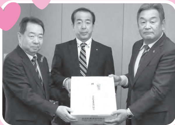
福祉餅の寄贈（余目町農協）