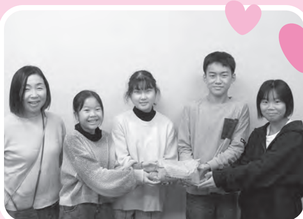
歳末たすけあい運動（余目第三小学校児童会）